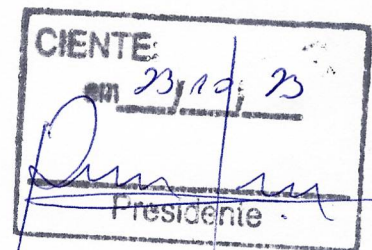
CLEMENTE ANTONIO DE LIMA NETO Prefeito Municipal

Sendo o que nos cabia para o momento, subscrevemo-nos renovando nossos protestos de consideração e respeito.