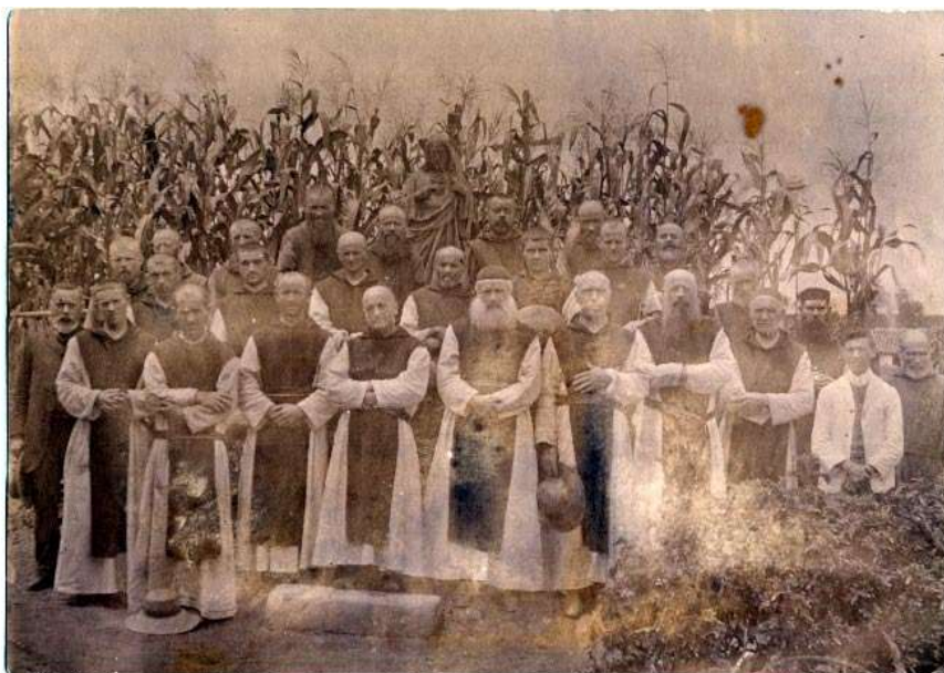
Figura 02: Monges Trapistas em Tremembé.