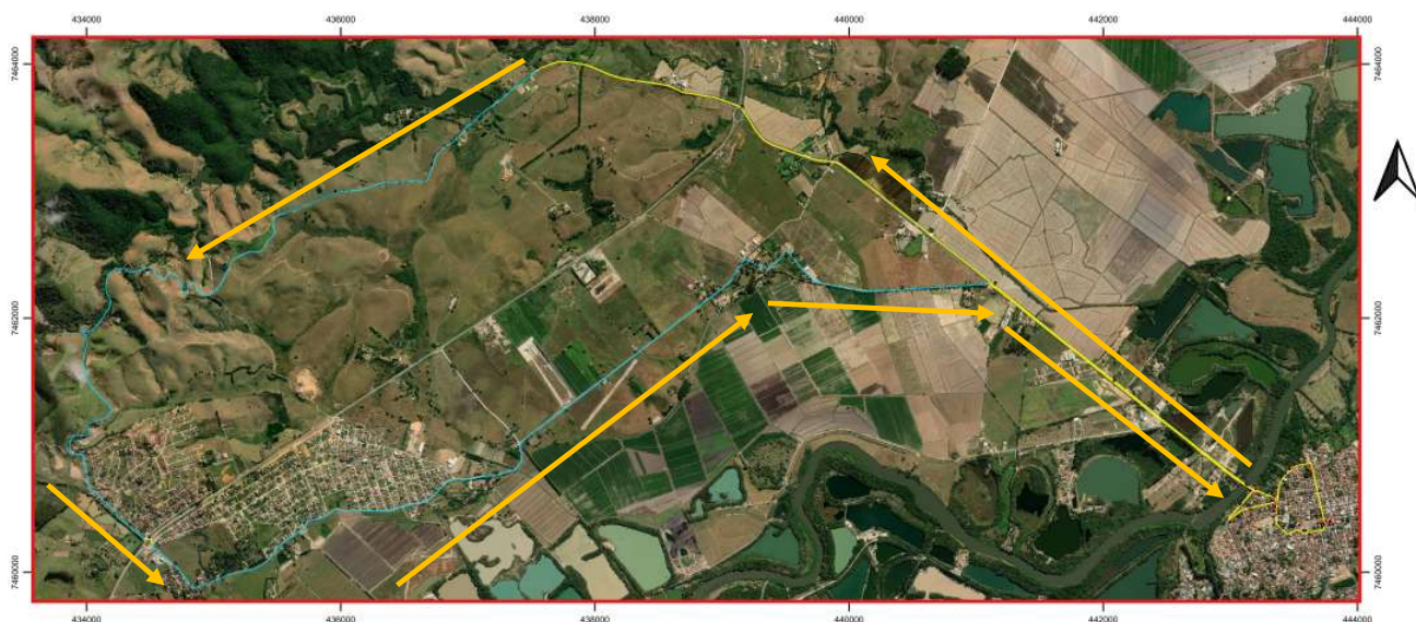
Figura 01: Croqui das sugestões aos deslocamentos (setas na cor laranja) definidas pela sinalização do roteiro do Circuito Trapista de Cicloturismo como apontado no artigo 2º deste Projeto de Lei. Vias do Circuito Trapista de Cicloturismo na cor azul correspondem às vias destituídas de pavimentação. Vias na cor amarela correspondem às vias pavimentadas.